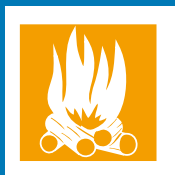
Bois-énergie Biomasse Valorisation des déchets